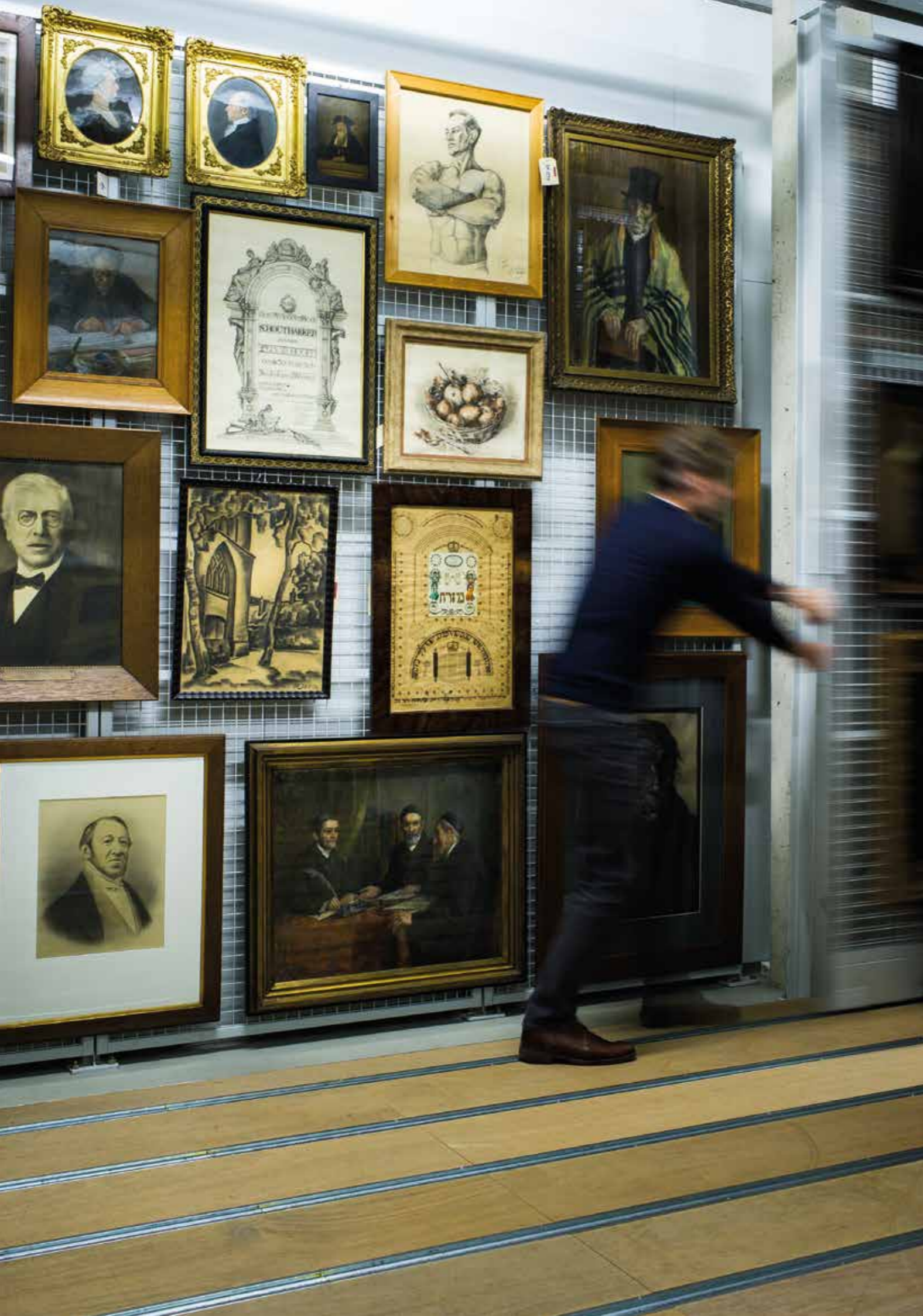
Depot Joods Historisch Museum, Amsterdam.

Het museum vervult zo binnen het krachtenveld roofkunst en restitutie verschillende rollen: het mist delen van de collectie, het krijgt zelf te maken met restitutieverzoeken en tenslotte adviseert en bemiddelt het in zaken tussen anderen en bepleit het binnen de publieke discussie de joodse zaak. Het streven is om zich binnen dit thema proactief, transparant, voorbeeld stellend en empathisch op te stellen. Dit alles binnen de door de wetgeving gestelde juridische kaders.