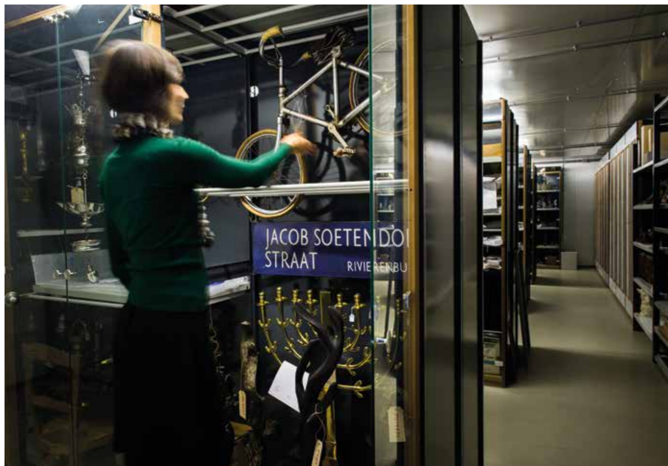
Depot Joods Historisch Museum, Amsterdam.

worden daarin getoetst zodat een duidelijk collectiebeleid gevoerd kan worden.