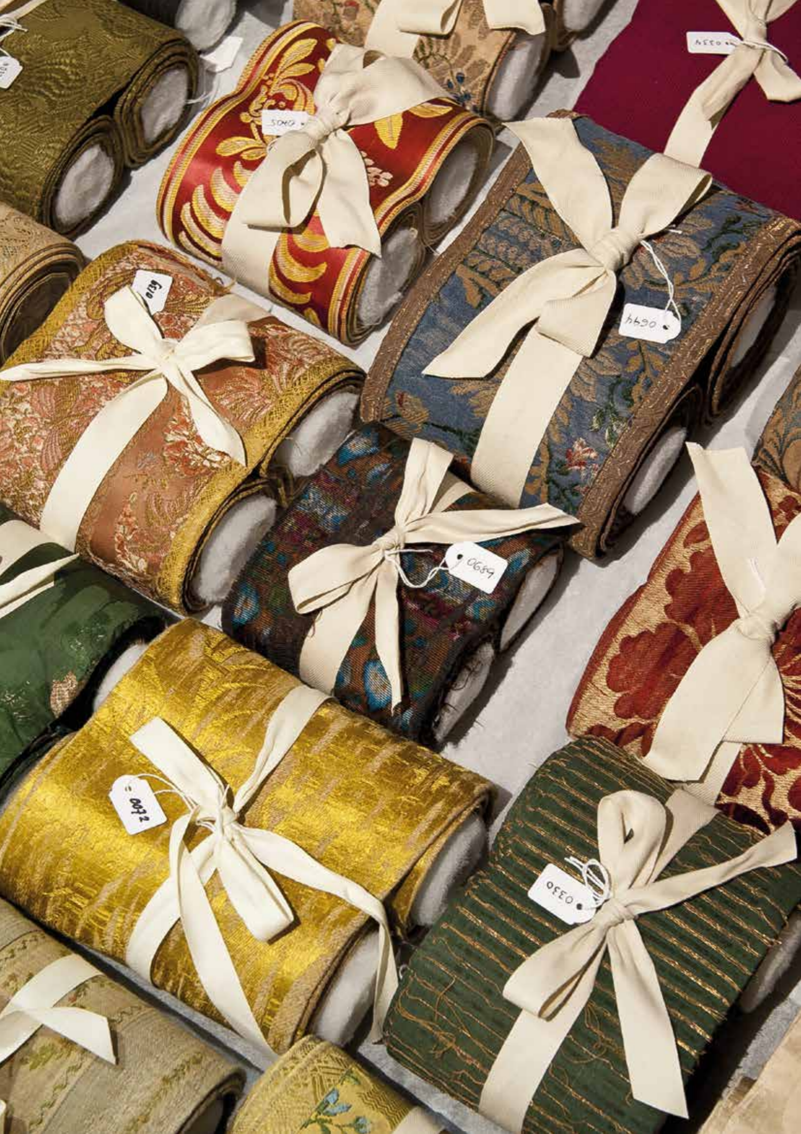
Textieldepot Portugese synagoge.