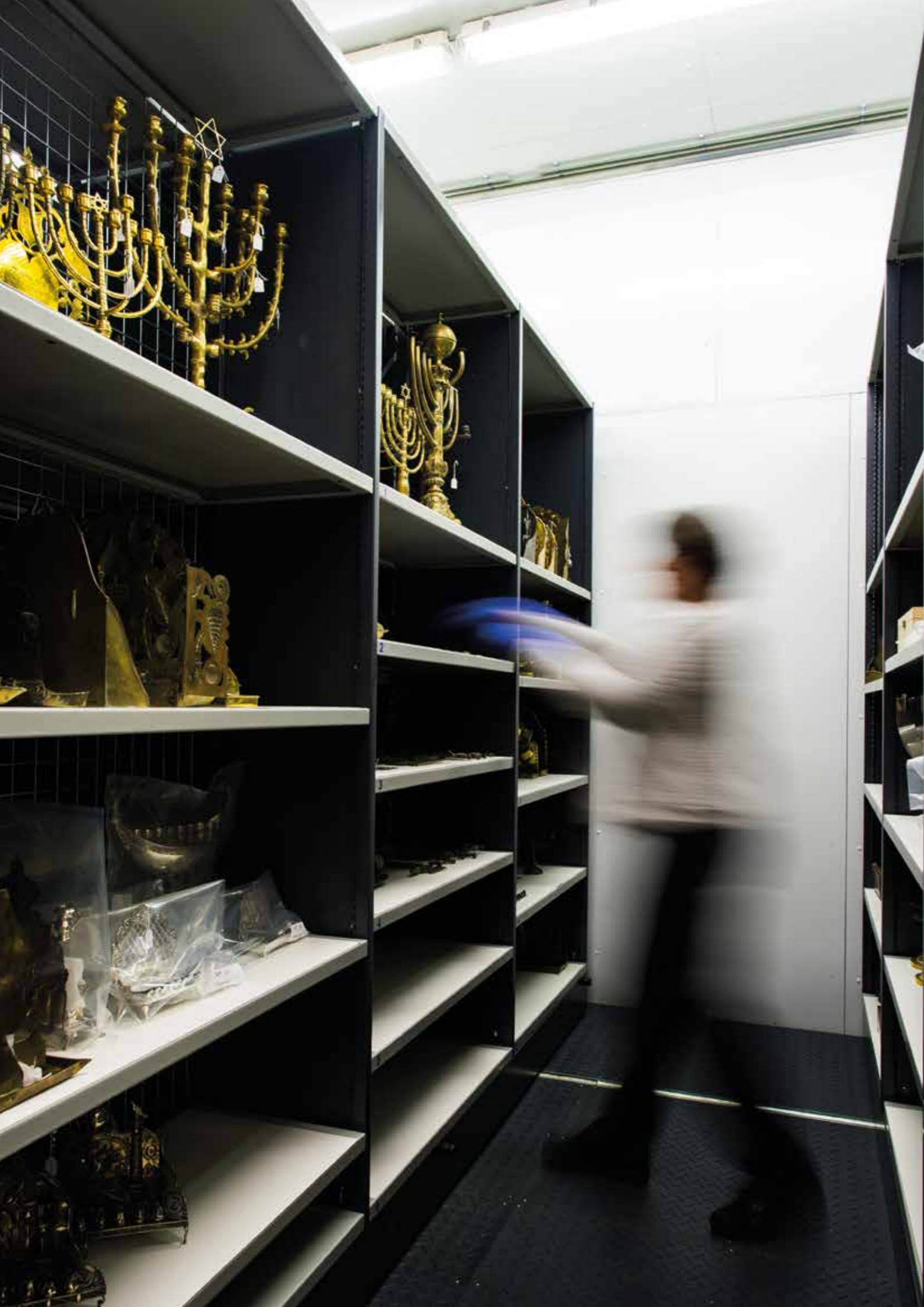
Depot Joods Historisch Museum, Amsterdam.