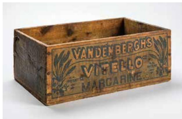
Collectie Joods Historisch Museum. Aangekocht met steun van de BankGiro Loterij

Ruim 2300 objecten vertellen het verhaal van de Nederlands-joodse geschiedenis. Zaken die het dagelijks leven weergeven, waaronder onder meer herinneringsobjecten, gereedschap, reclamemateriaal, speelgoed. Een belangrijk deelgebied betreft objecten uit het joodse bedrijfsleven. Dit verzamelgebied heeft extra nadruk gekregen door het onderzoek voor de tentoonstelling Venter Fabriqueur Fabrikant. Joodse ondernemers en ondernemingen in Nederland 1796-1940 . Kennis is ook opgedaan bij de tentoonstellingen over de joden in Nederlands Indië en Suriname waardoor de wens nog duidelijker is geworden meer objecten uit deze gebieden te verwerven. Op dit moment, in de aanloopfase van de inrichting van het NHM, wordt met meer aandacht gekeken naar de collectie objecten uit de Tweede Wereldoorlog.